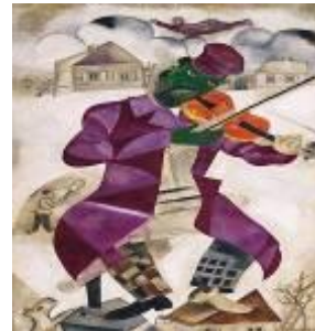
◎屋頂上的小提琴手