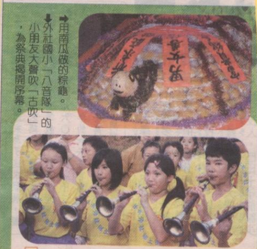
↓用南瓜做的粽龜。 外社國小「八音隊」的小朋友大嘗吹「古吹」的，為祭典揭開序幕。