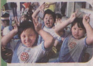
↑小朋友扮成十二生肖的可愛模樣。

外社國小負責製作的十二生肖寶寶，是今年的祭品，每一組學童都必須運用當地食材，做出和生肖有關的供品。像是鼠寶寶獻上由「鼠麴草」做的「鼠麴粿」；兔寶寶獻上紅蘿蔔製成的「記憶土司」，希望小朋友多吃紅蘿蔔，才有好腦力；豬寶寶獻上營養高的「豬菜」，宣導小朋友要多吃青菜，才能健康排便。小朋友一邊展現造型創意，一邊宣導