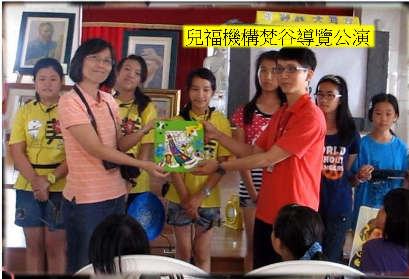
兒福機構梵谷導覽公演