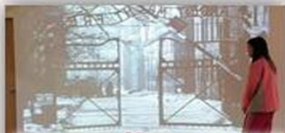
道德與現實的兩難