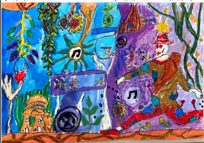
水彩鋪色+細節描摹+蠟筆完稿+作品分享