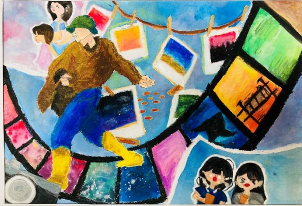
水彩鋪色+細節描摹+蠟筆完稿+作品分享